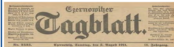
Cotidian al germanilor din Bucovina - Cernăuți 1911