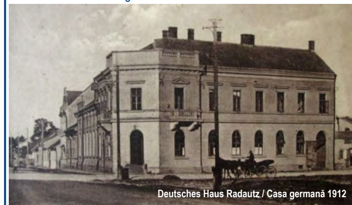
Deutsches Haus Radautz / Casa germană 1912

Datorită procentului ridicat al populației germane, îndeosebi după ocupația austro-ungară, s-a constatat necesitatea unui loc de întâlnire pentru etnicii germani. Astfel, a fost construită Casa Germană / Deutsches Haus , care avea să aibă o istorie foarte tumultuoasă. Ridicată în anul 1912, sala de spectacole avea 400 de locuri, găzduind spectacole, reuniuni, evenimente mondene ale comunității germane. Pe scena Casei Germane au evoluat Teatrul German din Berchtensgabe - 1928, Teatrul Evreiesc de Operetă din Viena - 1929, George Enescu - 1932, corul Bruckenthal, Teatrul din Sibiu și tenorul bucovinean de origine evreiască Josef Schmidt.