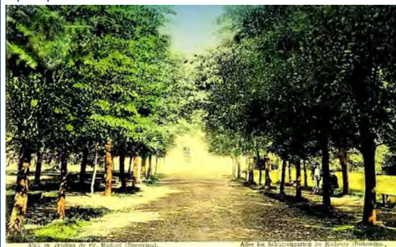
Grădina de tir Rădăuți-1905

În Rădăuți a existat Radautzer Schubertbund / Asociația Schubert , denumită după numele compozitorului Franz Schubert, care a promovat muzica clasică germană. A funcționat un cor la biserica romano-catolică, cunoscută în oraș drept " biserica nemțească ". În anul 1931 a luat ființă Asociația Culturală Germană pentru Bucovina / Deutscher Kulturverein fuer die Bukowina , care au colaborat strâns cu Musikverein / asociația muzicală și cu teatrul de amatori în limba germană din oraș. A existat și clubul sportiv Jahn , cu o echipă de fotbal destul de cunoscută. Presa în limba germană era larg răspândită în Rădăuți și în împrejurimi. După primul război mondial, s-a înființat Gimnaziul Real Privat German / Deutsches Privatrealgymnasium , pentru păstrarea identității lingvistice. Aproape toate evenimentele culturale se derulau în Grădina de Tir.