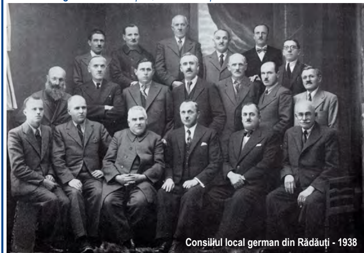
Consiliul local german din Rădăuți - 1938

Atât de mulți germani s-au stabilit în urbe, că Rădăuții au devenit cel mai german oraș al Bucovinei, ținând cont faptul că limba germană devenise lingua franca, vorbită de toate populațiile. Clădirile aferente Căpităniei Districtuale, ale Gimnaziului Real și ale funcționarilor și intelectualilor dau un caracter german Rădăuților, vizibil încă și azi.