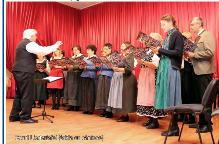
Corul Liedertafel (tabla cu cântece)

Această utilizare o are până în anul 1958, când va fi dat în folosință actualul sediu al Casei de Cultură din Rădăuți. După acest an, avându-se în vedere schimbările politice, clădirea este transformată în cinematograful intitulat "Flacăra". Abia după anul 1990, casa va reveni la vechea sa utilitate, aceea de centru de cultură și promovare a culturii germane, administrată de Uniunea Germanilor Bucovineni din Rădăuți / Verein der Radautzer Buchenlanddeutschen . Actualmente, aici funcționează cu succes corul Liedertafel (tabla cu cântece), care participă la diverse evenimente culturale ale comunității germane din Rădăuți, în țară și în străinătate.